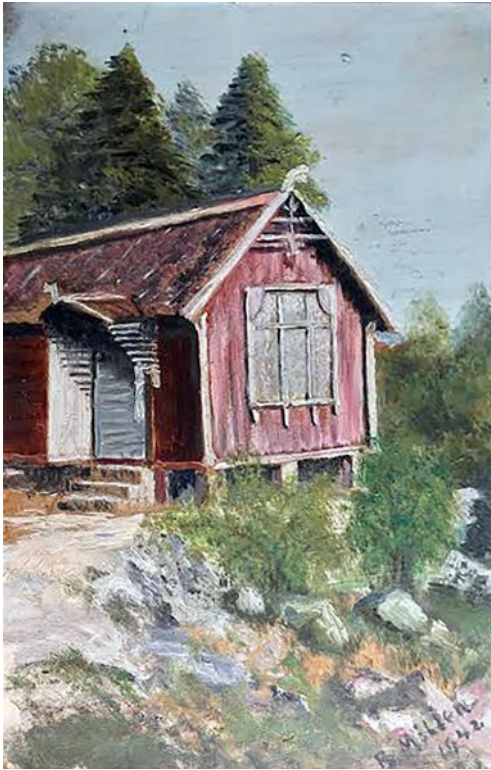
Snipp-Møllers hytte i Østensjø terrasse, malt av nevøen Bjarne Møller.

med sin fløyte og spilte sammen med direktørfruen eller datteren Frida som begge kunne traktere pianoet.