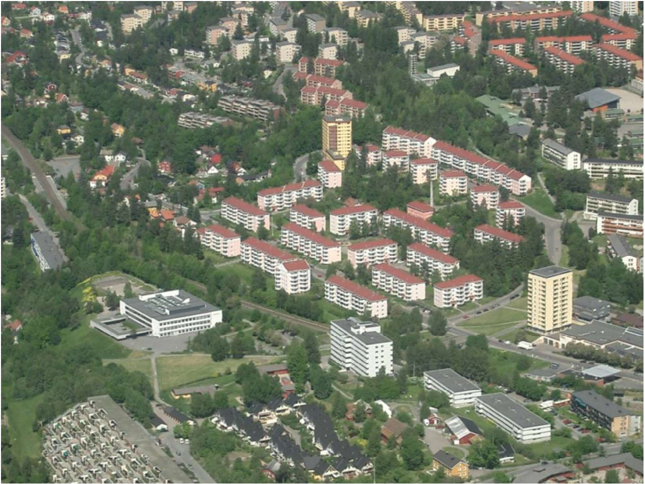
Oppsal gård er stengt inne av hus og blokker på alle kanter. Blokkene mellom Skøyenkroken i nord og Skøyenåsseveien i sør, langs Haakon Tveters vei sørover til Oppsal senter var gårdens beste jord. Oppsalhjemmet (planlagt revet for å bygge nytt) med betjeningsboligene legger beslag på resten. I vest Saga-husene og terrassehusene i Oppsal terrasse. I nordvest Skøyenåsen skole. Østensjø lokalhistoriske bilder nr. B20100055.