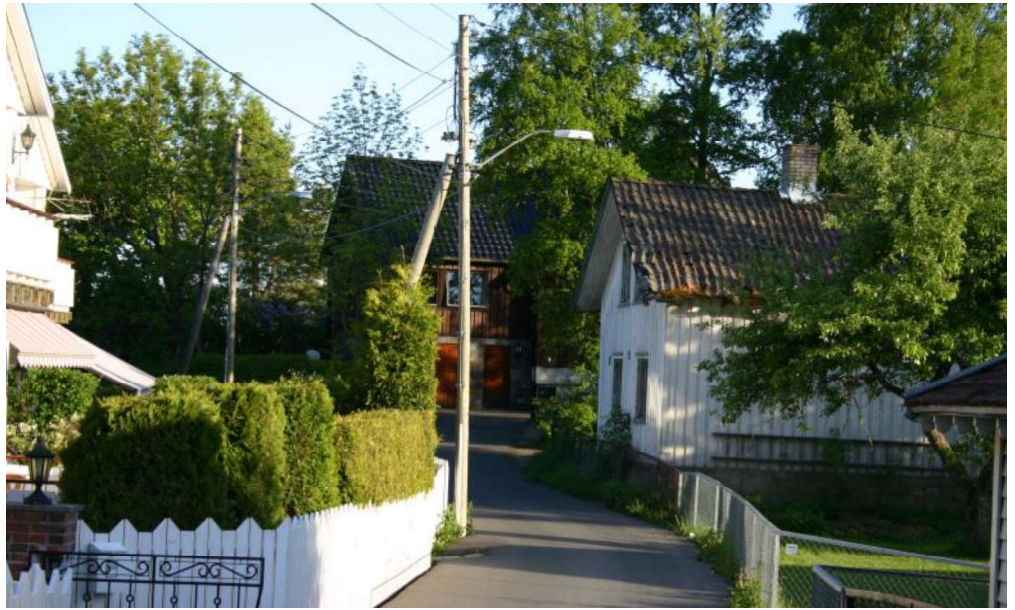
Det brune huset bakerst er hovedbygningen på Søndre Oppsal gård, nå Motbakkene 3. Huset står fortsatt, men ombygget til det ugjenkjennelige. Så sent som i mars 2013 ble det hvite huset til høyre revet, trolig en rest av uthusbygningene. 27.05.2004.