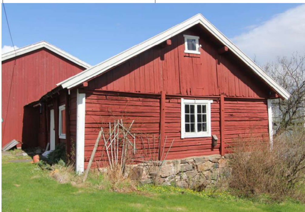
Det eldste fjøset.