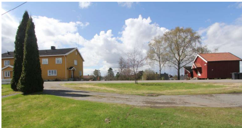
Gårdstunet. Det ovale gressfeltet midt på bildet markerer der gårdsdammen lå. Dammen var, hevdes det, egentlig et naturlig oppkomme, en kilde med godt drikkevann. I dammen var det i nyere tid karuss. Den ble fylt igjen på slutten av 1940-tallet. Til høyre stabbur og hønsehus, til venstre hovedhuset.