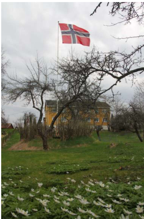
Flagget vaier i vinden. Stangen står på rydningshaugen, slik den har gjort fra 1920-tallet.