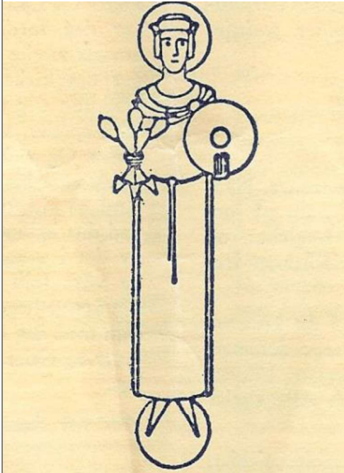
St. Hallvard, emblem på programmet ved feiring av Oslo bispedømme 900 år i 1971. Oppsal gård kan ikke ha kommet inn under Oslo Bispestol før biskopen hadde fått et avgrenset bispedømme, en gang etter 1071.

var hovedbølet viser at det må ha vært minst ett underbruk. Mye taler for at underbruket (underbrukene) forsvant under Svartedauden eller ble slått sammen med hovedbølet.