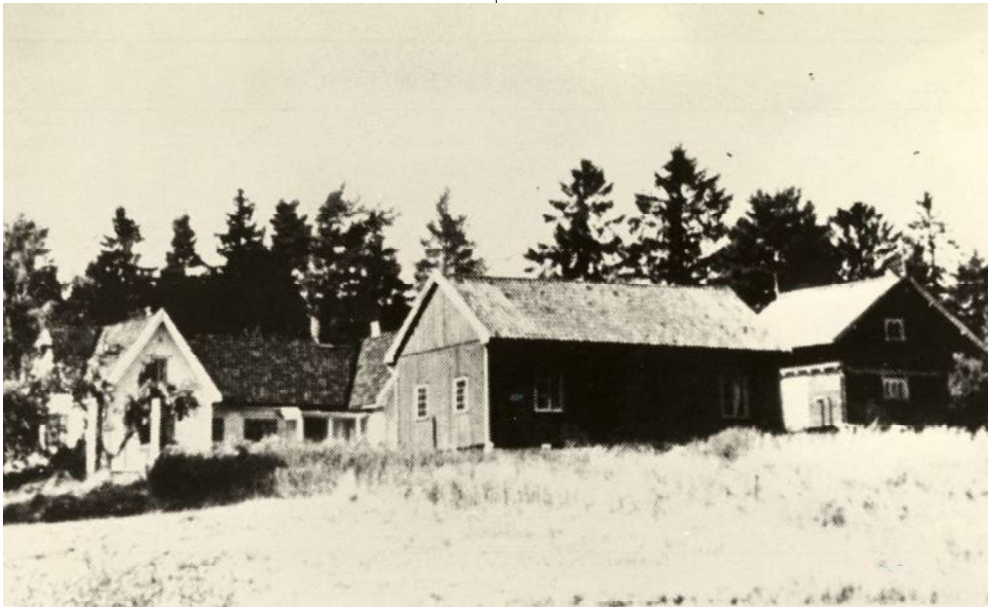
I 1823 ble bruk nr. 3, Jørgenslækken, utskilt og frikjøpt fra hovedbølet. På 1700-tallet var dette en husmannsplass under Oppsal gård. Jørgenslækken benevnes i folketellingen 1875 som Nordre Jørgenslækken, i folketellingen for 1891 som Oppsal Jørgenslækken. På kart og offentlige dokumenter fra 1915 og senere benyttes navnet Solbakken. Hovedhuset ble revet ca. 1990, uthus og stabbur tidligere.