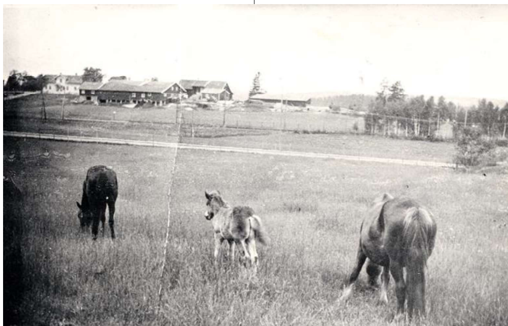
Hestene fra Oppsal gård gikk gjerne på beitemarkene der Oppsal senter er i dag. Den beste jorda lå øst for gården, avskåret av trikken som kom i 1926 og Haakon Tvetters vei fullført i 1933. Både trikk og vei delte østsiden av jordeiendommen i to. Østensjø lokalhistoriske bilder nr. B20030203. Foto: Løvseth-familien.

I 1929 ble det søkt om oppføring av et våningshus vest for hovedhuset. Etter tegninger og kartskisse kan det ikke være annet enn huset som i dag benevnes "Fjellet". Begrunnelsen for oppføring av huset var plass til arbeidsfolk, i enkelte dokumenter kalt tjenerbolig. I tilknytning til boligen ble det også søkt om kloakkanlegg til kum. Drikkevann var tilgjengelig ved henting fra vannpost. Samme år ble det reist et uthus i tilknytning til dette våningshuset.