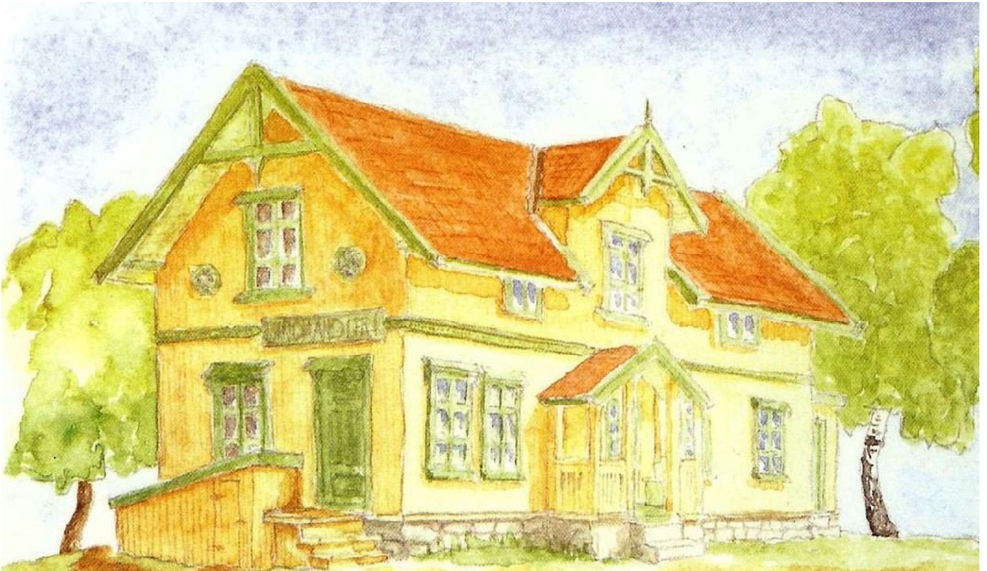
Hovedbygningen slik den var før ombyggingen på slutten av 1940-tallet. Utsnitt av akvarell av Ivar Håkenstad 1997.

Oppsal gård var som andre gårder i Aker preget av at Christiania vokste fra ca. 7 000 innbyggere i 1790-årene til ca. 76 000 i 1875. Det ble et stort behov for landbruksprodukter. Akerbygda var nærmest til å skaffe disse produktene og solgte sine produkter til byen mot kontant oppgjør. Oppsal var intet unntak.