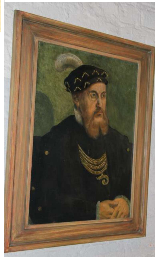
Christian III, regent 1536-1559. J. Verheiden (kopi av Pållesen). Malmøhus. Ved reformasjonen i 1536 var det kongen som ble eier av kirkegodset, deriblant Oppsal gård.

Kirken eide før reformasjonen de fleste (over 80 %) av gårdsbrukene i Aker. Bøndene og kro-