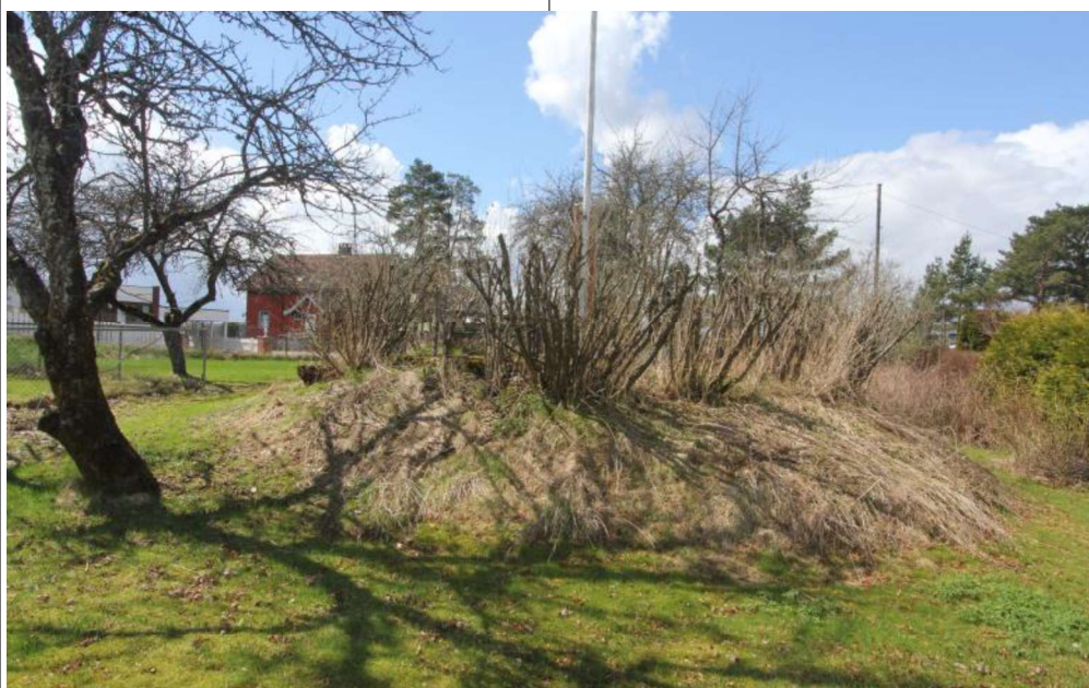
Lenge verserte haugen i frukthagen vest for hovedbygning med flaggstang på toppen som gravhaug, men nyere undersøkelser av byantikvaren viste at det var en rydningshaug. Platået på haugen ble anlagt tidlig på 1920-tallet.

Ved utgangen av høymiddelalderen var det rundt 300 gårder eller gårdsbruk i Osloherad. Etter Svartedauden i 1349/50 ble en rekke gårder lagt øde, en nesten like stor nedleggelse av gårder som boligreisningen i dag har medført. Gårdene rundt Østensjøvannet klarte seg forholdsvis bra, ikke minst pga. de gode