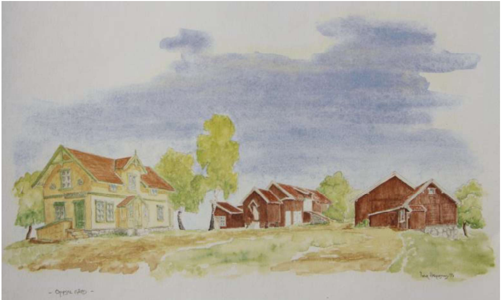
Oppsal gård før ombygging av hovedhuset i 1948/1949. Landhandelen, med inngang i hovedhusets søndre kortsida, opphørte i 1938. Midt på bildet stabbur med hønehuset til venstre. Bak slaktebu for gris. Låven bak falt ned i 2006. Til høyre det eldste fjøset og låven. Gårdsdammen er skissert med blågrønn farge på tunet. Akvarell av Ivar Håkenstad 1997.

Hvor lenge det har vært drevet gårdsbruk på Oppsal, vet vi ikke. Men gårdsbrukene rundt Østensjøvannet hører til den al-