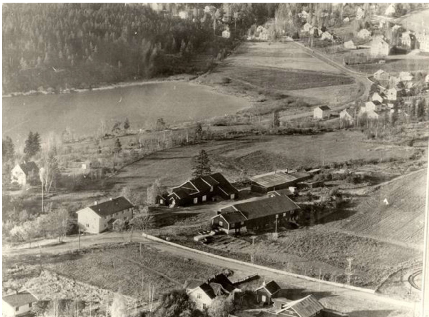
Dette flyfoto fra tidlig på 1950-tallet viser at Oppsal gård ligger høyt i landskapet. Grensen mot vest er Østensjøvannet. Bygningen til venstre er hovedhuset som ble renoverert og ombygget på slutten av 1940-tallet. Den nærmeste driftsbygningen på østsiden (høyre) er fjøs, låve og stall. På motsatt side låve og slaktebu som falt ned i 2006. Stabburet står fortsatt. Til venstre for stabburet hønsehuset. Til høyre for låven vognskjulet som brant i 1975. Her ble det etter brannen bygget garasjer. Bakenfor er grisehusene. Huset mellom driftsbygningen og veien er den såkalte "Melbua" (delvis skjult), bygget av tyskerne under krigen. Jordveiene på vest og østsiden av gården. Jordstykket øverst i bildet tilhører nabogården Søndre Skøyen og ble kalt "Slora". Rønningjordet går ned mot Østensjøveien. Huset helt til venstre er eiendommen "Fjellet" under Oppsal byggeanmeldt i 1929. I bildets nedre høyre kant skimtes trikkelsløyfen. I forkant langs Oppsalveien nabogården Rustad som er revet. Stabburet står fortsatt, men flyttet noen meter. Østensjø lokalhistoriske bilder nr. B20030057

Henriksen). Selv om det er få spor av seterdrift i Østmarka er det ikke usannsynlig at Oppsal gård har hatt beiterettigheter helt inn mot Elvåga.