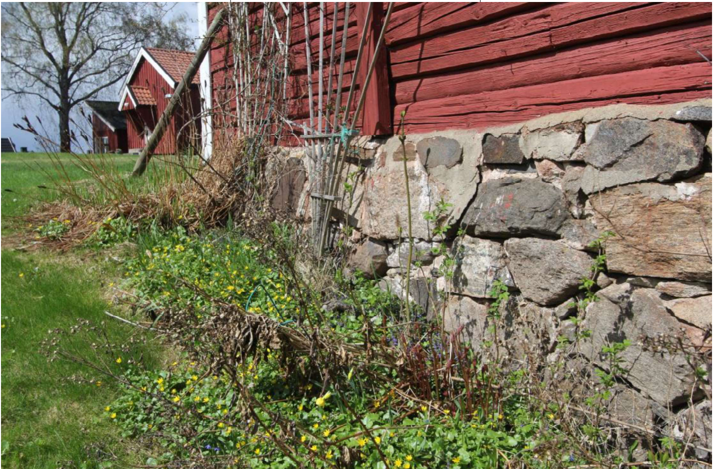
Grunnmuren til fjøset. Stabburet på motsatt side av tunet.